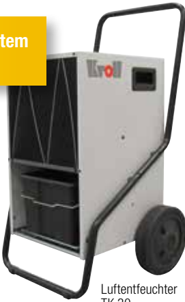
Luftentfeuchter TK 30