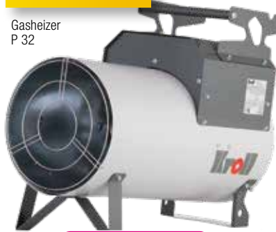
Gasheizer P 32